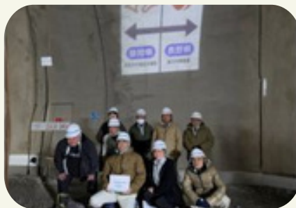
トンネル内 県境にて

三遠南信自動車道で最難関工区といわれる県境の青崩峠トンネルの視察をさせていただきました。内部のコンクリート覆工面等は、高規格道路としての完成度の高さを確認することができ、1日も早い開通が望めます。