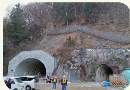
本坑と調査坑 調査坑は、完成後に避難道になります