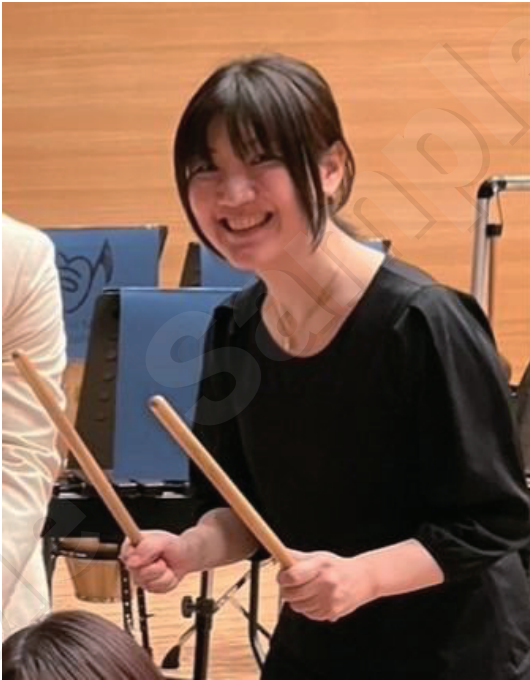
一般の吹奏楽団体に所属し打楽器を担当していました

至らぬ点ばかりだと思いますので、どんどんアドバイスいただけたら嬉しいです。これからよろしくお願いします。