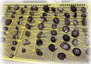
↑地区の方に頂いた椎茸 来年は私も・・・！

また、自然環境に配慮した農業にも興味があるので、これからいろいろな学んで行きたいです。