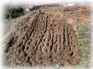
↑なんとか耕した畑