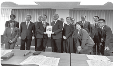
長野県 栗林建設部長へ要望書の手渡し