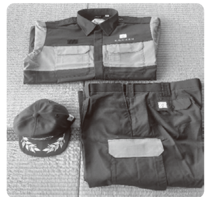
▶ 整備した夏用活動服