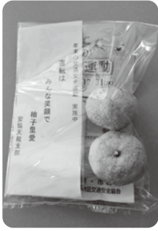
“ゆずりあい”にちなんだ柚子

冬季は雪や凍結によるスリップ、夜間の事故が増える時期です。スピードやライトの早めの点灯を意識しましょう。また、年末年始は飲酒が多くなる時期です。飲酒運転は絶対にしないようにしましょう。