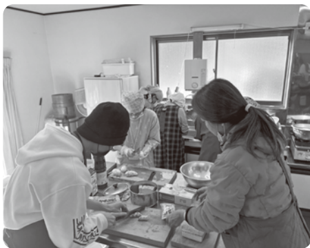
メニュー「大汁」・「こんにゃくのくるみ和大汁」