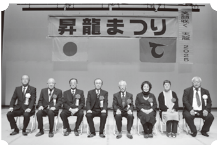
表彰式にご出席していただいたみなさん

国民健康保険の被保険者であり、3年以上にわたり、保険を使用しなかった世帯で、国民健康保険税を完納した世帯のみなさんです。