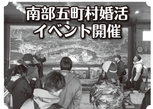
トレッキングコースの説明を受ける参加者