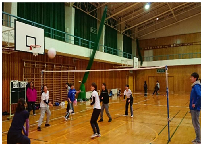
ソフトバレーボール大会