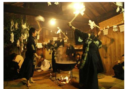
大河内池大神社例祭