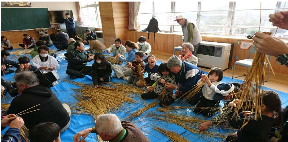
おやす・しめ縄づくり