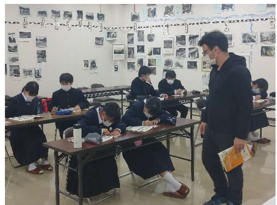
中学校放課後英語塾