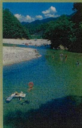
和知野川キャンプ場