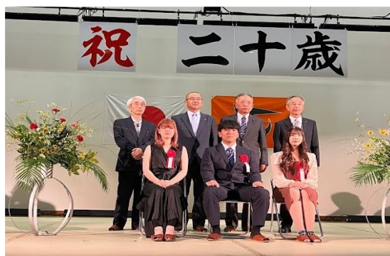
成人年齢は18歳になりましたが、これまで同様20歳の節目に式典を開催していますみなさん、おめでとうございます！！