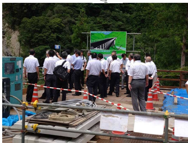
国道418号の総会では足瀬の現地視察も