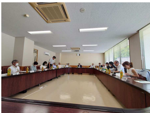
昨年開塾した「南宮学習塾」についても報告あり