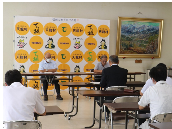
後藤代表監査委員と共に7月20日から審査