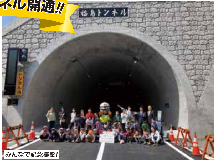
みんなで記念撮影!

国道418号的瀬と福島を結ぶ福島トンネルの開通式が4月28日(金)に行われました。 式典は、衆議院議員や県議会議員など関係者をお招きし、厳正かつ盛大に行われ、式典終了に伴い、同日福島トンネルが供用開始となりました。 トンネルの延長は762mで、的瀬と福島間の移動時間は従来より約5分短縮されています。 福島トンネルは、令和2年1月に発生した早木戸地籍の大崩落が契機となり、国道のトンネル化による抜本的な道路改良が決定し、令和3年6月に掘削を開始、令和4年2月にトンネルが貫通し、今回開通する運びとなりました。 なお、今後も当面の間、トンネル出入口付近では取付道路工事が行われますので、通行する際にはご注意いただきますようお願いいたします。