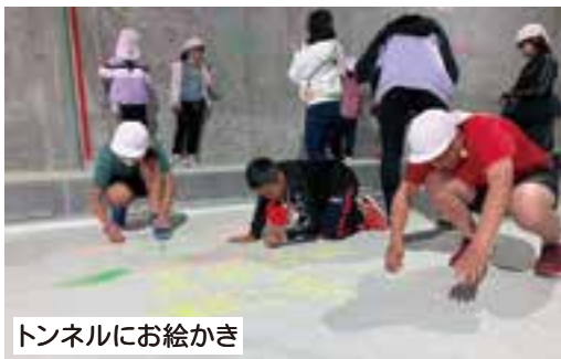
トンネルにお絵かき