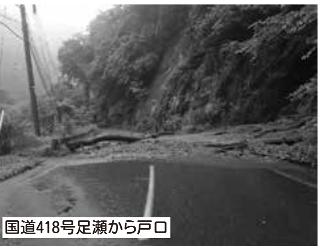
国道418号足瀬から戸口

この度、被災された皆様に心からお見舞い申し上げます。 村ではより一層、防災力の強化に努めて参ります。