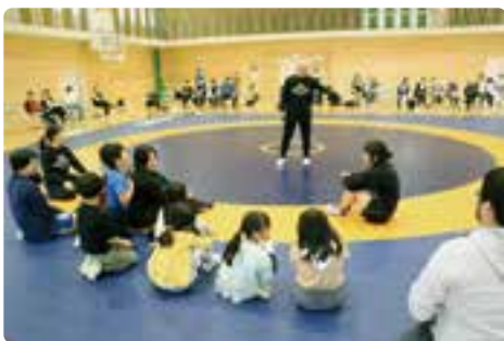
栄監督の指導の下、レスリング体験