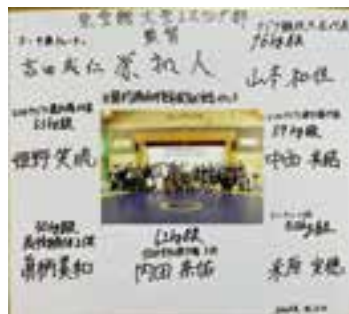
色紙は総合体育施設に飾ってあります

4月22日(土)に総合体育施設の完成を祝う記念イベントを、中学生によるハンガートプロジェクトを通じて親交のある至学館大学(愛知県大府市)女子レスリング部をお招きし開催しました。当日は、レスリング部員をはじめ、栄監督、コーチ、学校関係者が来村され、レ