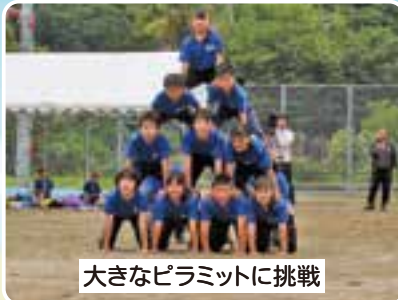
大きなピラミットに挑戦