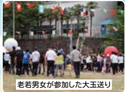
老若男女が参加した大玉送り