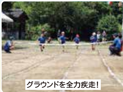
グラウンドを全力疾走!