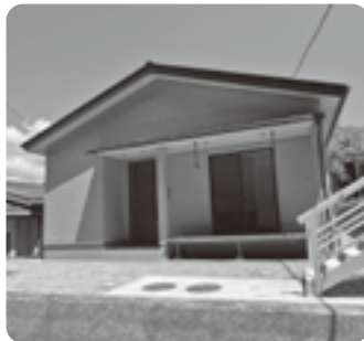
向方地区に住宅建設!