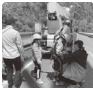
高所作業車にドキドキ!