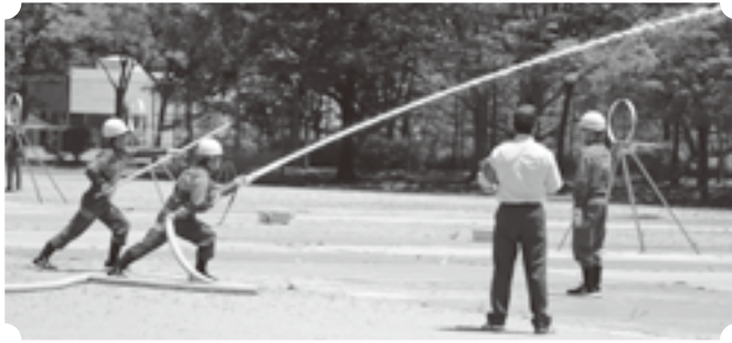
令和5年度 飯伊消防技術大会開催

天龍村消防団は第1分団、第2分団の合同チームで、経験が浅い団員の消防技術の習得を目的として、各分団の操法未経験者を中心にチームを編成し、週に2回天龍中学校グラウンド