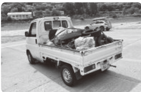
軽トラ1台分のゴミが集まりました

新型コロナウイルス感染症対策などにより、天竜川沿いの清掃活動は令和元年度以来となりましたが、近年問題となっているプラスチックごみなどの海洋流出防止に向け、来年度以降も環境美化活動を継続しますので、みなさんのご協力をお願いいたします。