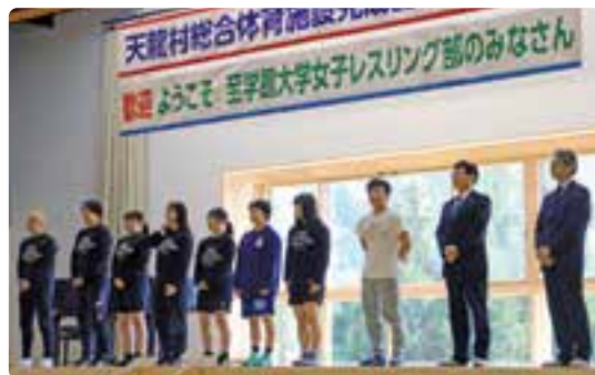
至学館大学女子レスリング部、学校関係者のみなさん