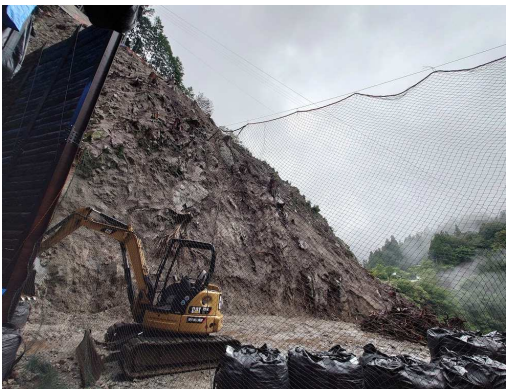
戸口側に出ると対岸に集落が見えます。