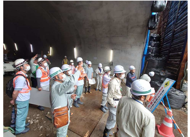
足瀬のトンネルは歩いて戸口側へ。トンネル用の円形水路（側溝）など内部の工事が進められています。