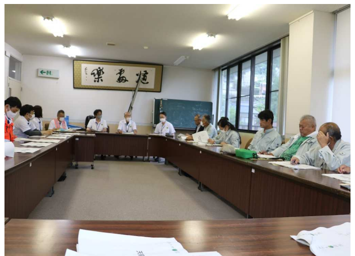
長野県の事業について説明を受けました。