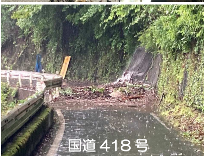
国道 418 号