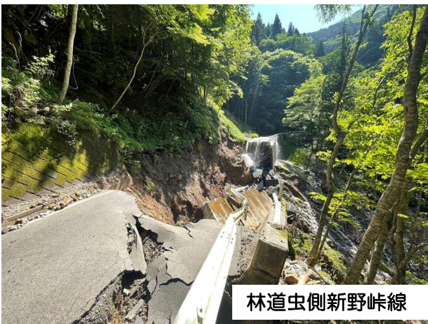
林道虫側新野峠線

令和 5 年 6 月 2 日から 3 日にかけての台風 2 号及び前線の活発化に伴う大雨の影響により、村内各地で甚大な被害が発生しました。被災された皆さまに心からお見舞い申し上げます。今後も大雨や台風等には注意してお過ごしください！