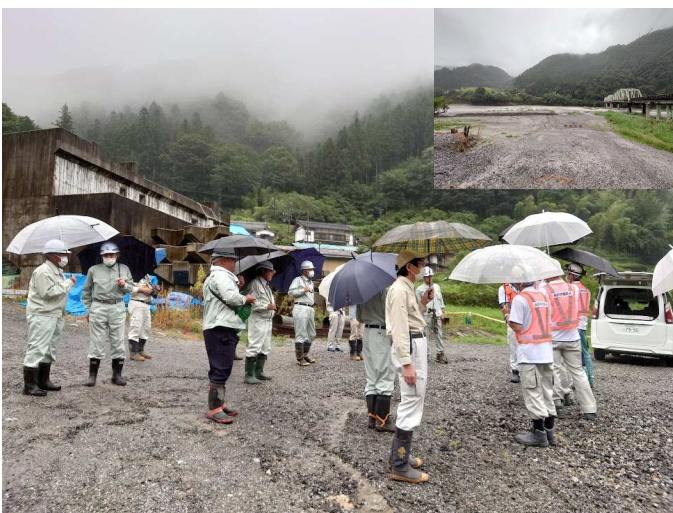
鶯巣の天竜川橋は次の濁水期まで休工です。。

♪豆知識♪ トンネルの壁にはコンクリート厚の表示があるんです。ぜひ探してみてくださいね！