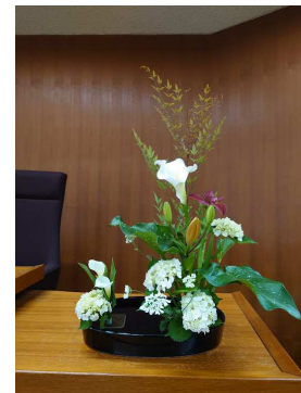
6月議会のお花しょう いしやめさかやういけさお

雨の音などで何を言っているか聞こえなかった、通行止めの放送が入ったかな？など、もしもの時にはぜひご活用ください！