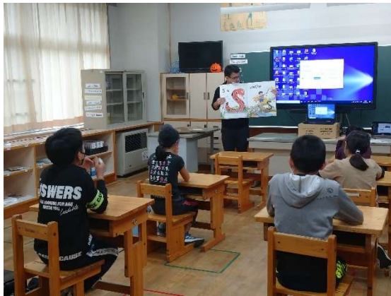
小学校放課後英語塾