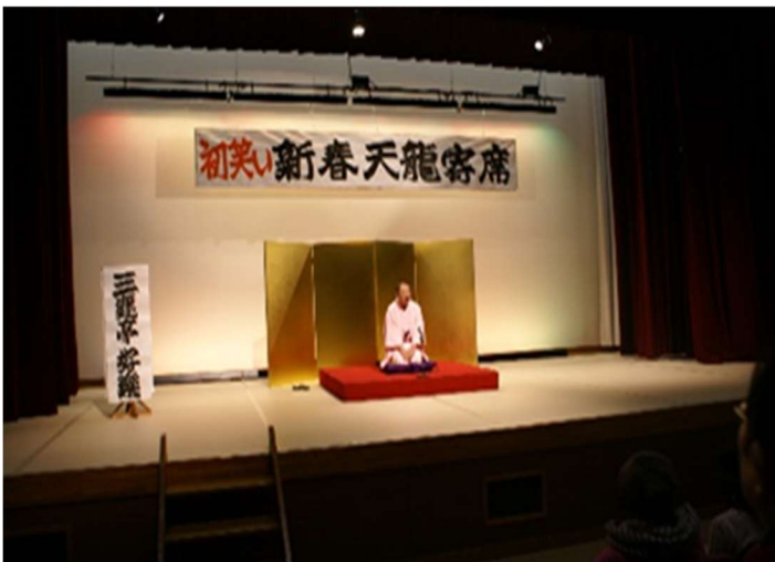
天 龍 寄 席