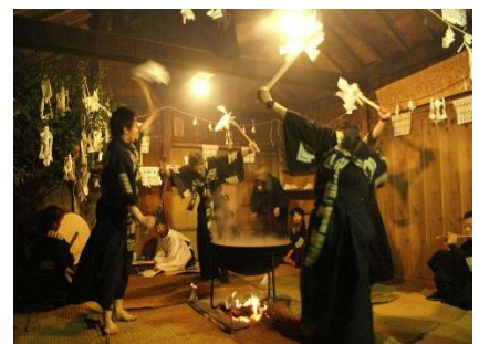
大河内池大神社例祭