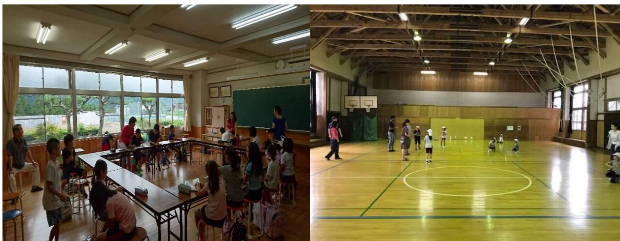
天龍村放課後子ども教室（しゅろ教室・体育館）活動の様子

※通学合宿：地域の異年齢の子どもたちが、1週間程度の期間、公民館等に寝泊まりし、炊事や掃除、身の回りのことを自分たちで行いながら平常日に通学する体験活動のこと。