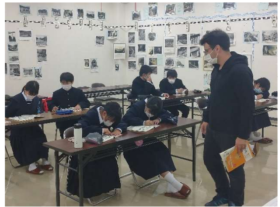
中学校放課後英語塾