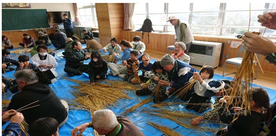
おやす・しめ縄づくり