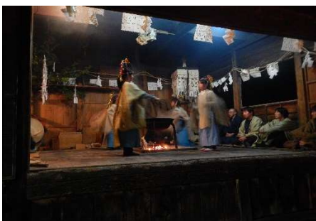
向方のお潔め祭り