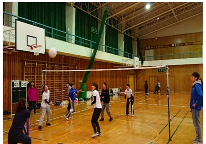
ソフトバレーボール大会