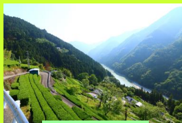
中井侍地区の茶畑

気候は県内でも温暖で、「信州に春を告げる村」として長野県内で最も早く桜が開花します。雪もほとんど降らず、温暖な地形で育つお茶やゆずが村の特産品です。また、天龍村を含む南信州地域には古くから続く「伝統芸能」が多くあり、文化に触れながら地域の方たちとの交流が行われています。