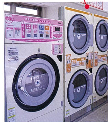
大型洗濯乾燥機1台、中型乾燥機4台、硬貨両替機を備えています。