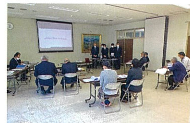
設計プロポーザル審査会