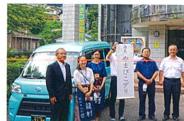
やまびこデリ出発式