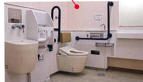
バリアフリー、オストメイト対応、おむつ交換台、着替え台が用意されています。このほかにも洋式トイレが1ヶ所設置されています。