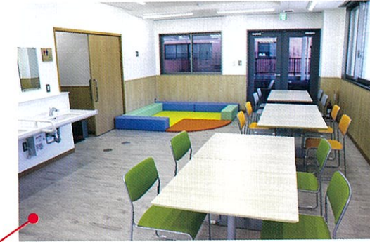
普段は休憩や飲食ができる休憩所として自由にご利用いただけるほか、イベント等の開催を行うことができる屋内の交流スペースです。キッズコーナーも併設しています。