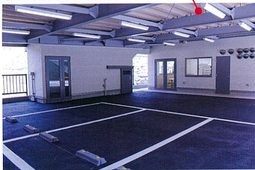
普段は駐車場としてご利用いただけるほか、イベント等の開催を予定している場所です。