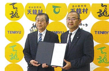
阿南ショッピングセンターとの協定締結