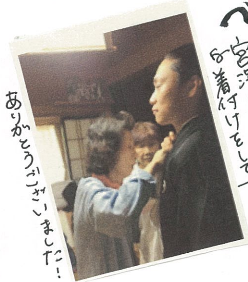
ありがとうございます!!