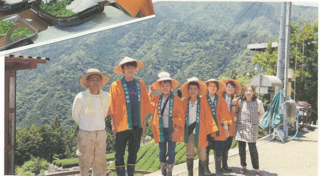
花ちゃんもツアーに参加してくれました。

いつもツメモガキ新聞を読んで下さりありがとうございます。今まで毎月発行させていただいていましたが、来月より不定期発行とさせていただきます。たくさんもがいて、より充実した紙面をお届けできるようがんばります。これからもどうぞよろしくお願い致します。