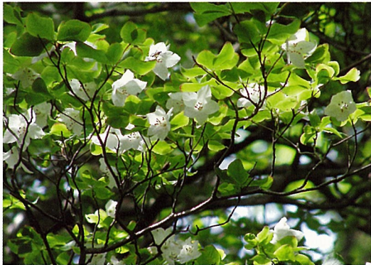
初夏を告げるシロヤシオの花 (5月下旬)