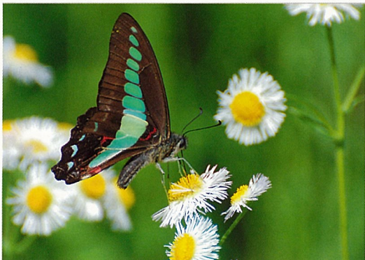
登山口へ向かう林道で アオスジアゲハ (7月)