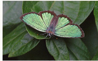
羽を休めるミドリシジミ (6月下旬)