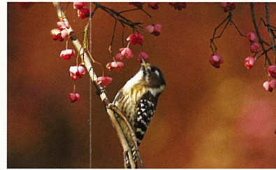
キツキの仲間コゲラは愛らしい(周年)