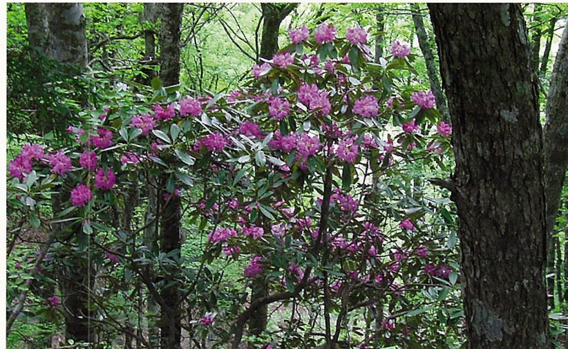
シャクナゲの大群落 (5月下旬)

四方名所 東は武佐秋の月 西には名馬と川がある その名も清くして龍川 南は清い滝がある 山には十方峠がある 四方名所のその中に