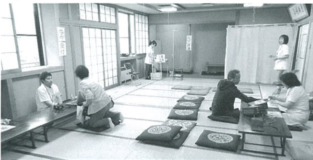
老人福祉センターでの健診の様子

健診を受けなかった方については、後日個別健診のお知らせをしますので、自分の健康状態を把握するためにも、ぜひ、この機会に受診しましょう！