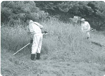
松島ヘリポート草刈り作業

「賠償責任」とは、地区の草刈り作業を行いました。当日は、あいにくの雨模様でしたが、効率的に作業を行うことができました。