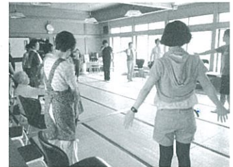
昨年8月に行われた健康づくり体操の様子（南上）

TEL:32-2001 FAX:32-2525 E-mail:suishin@vill-tenryu.jp