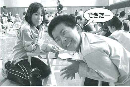
綺麗にイスが完成!!

夏休みの日、いつもと違うお友達と少年団の活動を通じて交流できたことが良い思い出になったと思います。