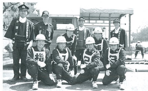
選手のみなさんお疲れさまでした

大会当日は猛暑にも関わらず選手たちは日頃の訓練成果を発揮し、結果は23チーム中15位の好成績でした。長い訓練期間中、グラウン