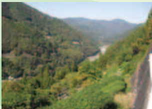
中井侍から天竜川上流を望む 中井侍から天竜川下流を望む