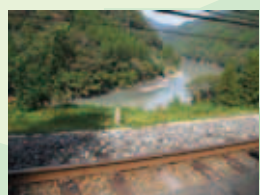
なかいさむらい駅から天竜川を望む