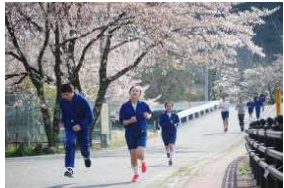
【若鮎 Sports(10分間走) 4/8】