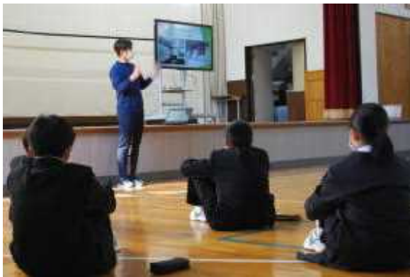
【オリエンテーション 4/27】

天龍村や天龍中学校が大切にしている探究的活動（梅花PROJECTやハンガーPROJECT）の時間、読書や運動を楽しむ時間を確保すること、さらには生徒の学習や生活の悩みの相談に応じる時間を確保することを目的に放課後20分程度の時間で行っている活動です。