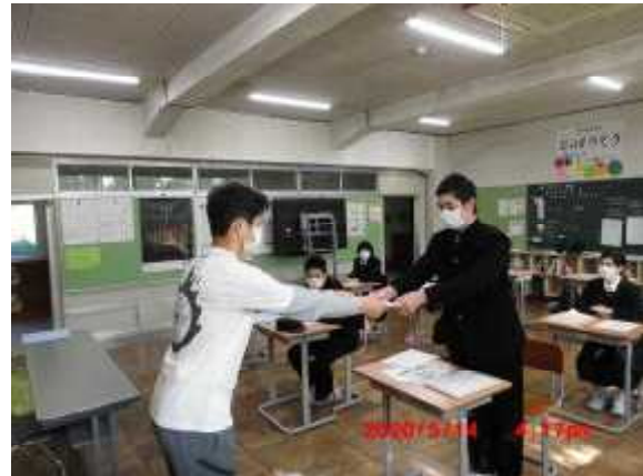
天龍村社会福祉協議会より 手作りマスクをいただきました。