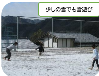
少しの雪でも雪遊び