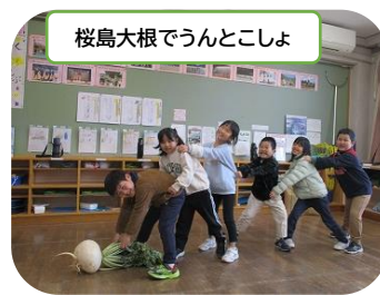
桜島大根でうんとこしょ