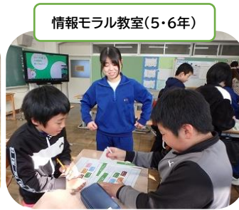
情報モラル教室(5・6年)