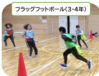
フラッグフットボール(3・4年)