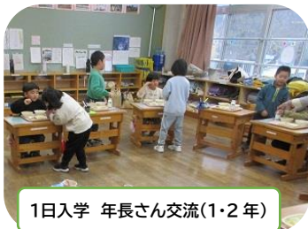
1日入学 年長さん交流(1・2年)